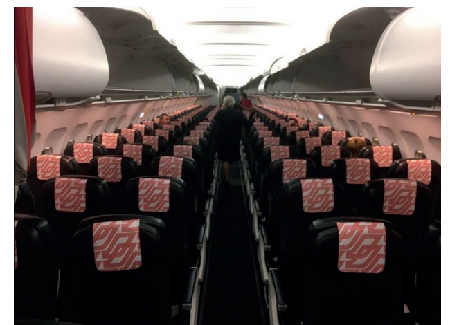
Cet avion va décoller malgré l'absence de passagers...

Cette baisse de l'activité a en quelque sorte permis à la nature de revivre. D'une part, les oiseaux ont pu se développer sans les nuisances sonores causées par les avions. D'autre part, cela a permis de limiter nos émissions de gaz à effet de serre : les avions sont responsables de 12 % du total des gaz émis par les transports. En revanche, au début de la pandémie, les compagnies aériennes ont fait voler des avions avec seulement quelques passagers pour garder leurs créneaux de décollage et d'atterrissage.