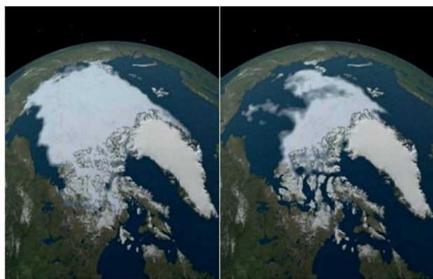
La banquise autour du Pôle Nord en 1984 (gauche) et en 2012 (droite)

Aujourd'hui, avec l'activité humaine grandissante et les nouvelles constructions, la nature est de plus en plus mise à l'épreuve. En effet, par exemple, la fonte des glaces due au réchauffement climatique devient de plus en plus inquiétante au fil des années. Malheureusement, cette cause touche peu de personnes car cela ne se passe pas près de chez nous et qu'on ne voit pas les résultats directs... Pourtant, cette situation est bien réelle !