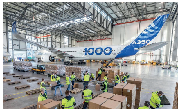
Le 1 er A350 d'Airbus revenant de Tianjin près de Pékin avec sa cargaison.