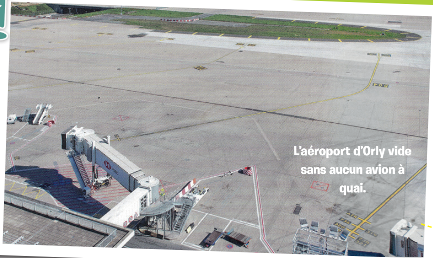
L'aéroport d'Orly vide sans aucun avion à quai.