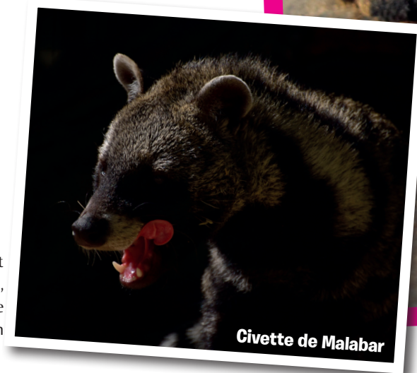
Civette de Malabar